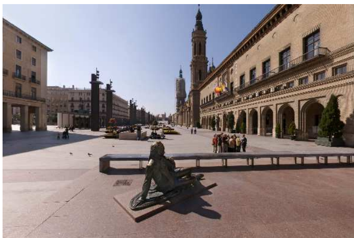
Imagen donde se situará el escenario